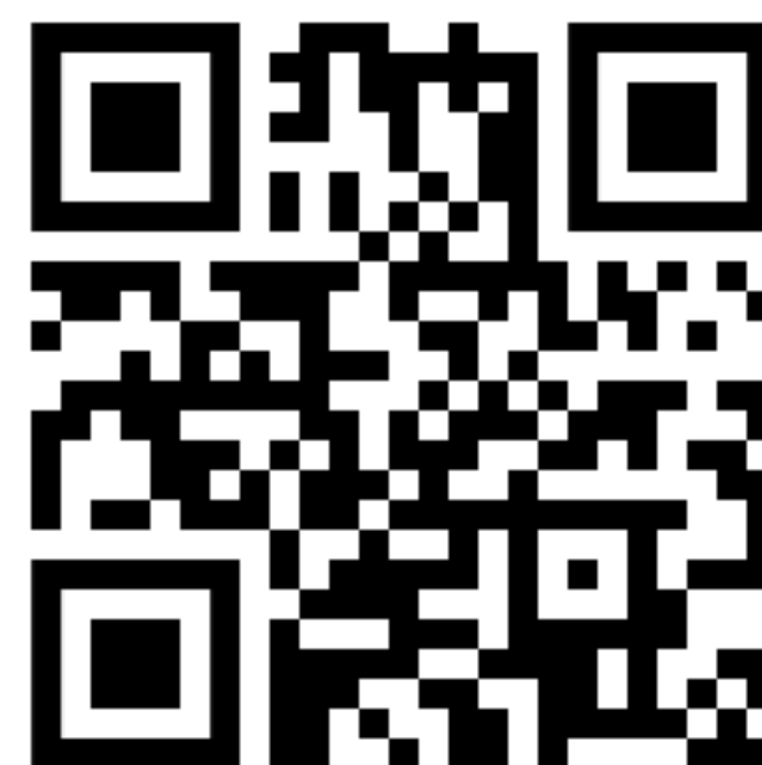
Figura 2 – Link da Plataforma via QRCode

Visite a plataforma no QRCode a seguir e tenha acesso não só aos melhores talentos universitários mas também as melhores oportunidades em startups.