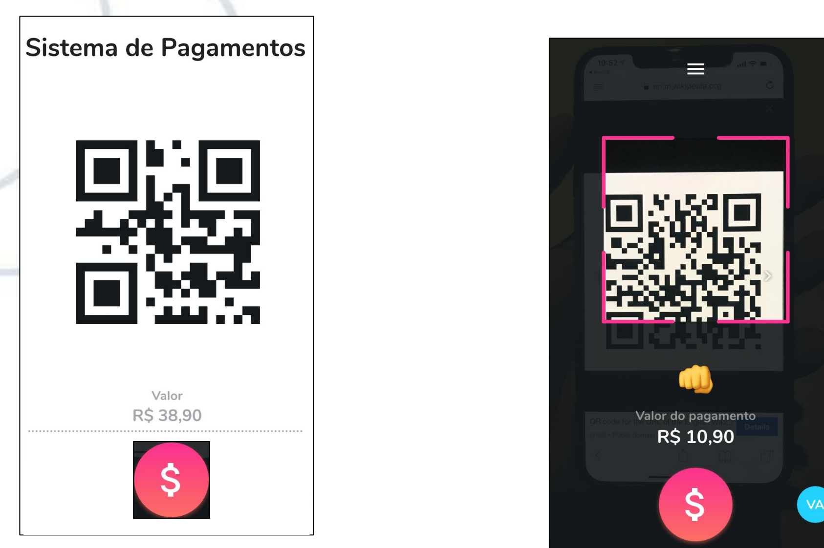
Figura 3 - Aplicativos de pagamento (à esquerda) e de recebimento (à direita).

De forma a manter o sistema seguro, o aplicativo foi dividido em dois: um primeiro para realizar pagamentos; e outro para efetuar recebimentos. A Figura 3 ilustra as principais telas dos aplicativos de pagamento e recebimento, respectivamente.