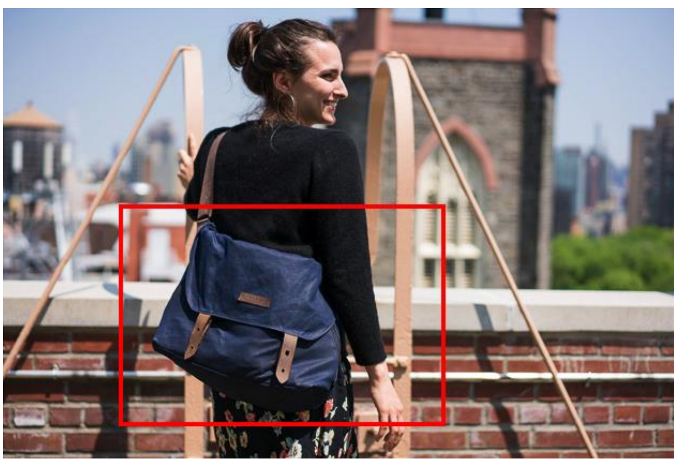
Figura 1 – Representação da ideia do projeto

E se você gostasse de alguma bolsa na rua, não soubesse nada sobre ela, e quisesse comprar? Nem sempre é fácil encontrar um produto que queremos na internet, já que ferramentas de busca, como o Google, só conseguem fazer buscas através de elementos textuais. Este projeto pretende oferecer às pessoas um meio de buscar mais informações sobre um produto através de uma imagem.